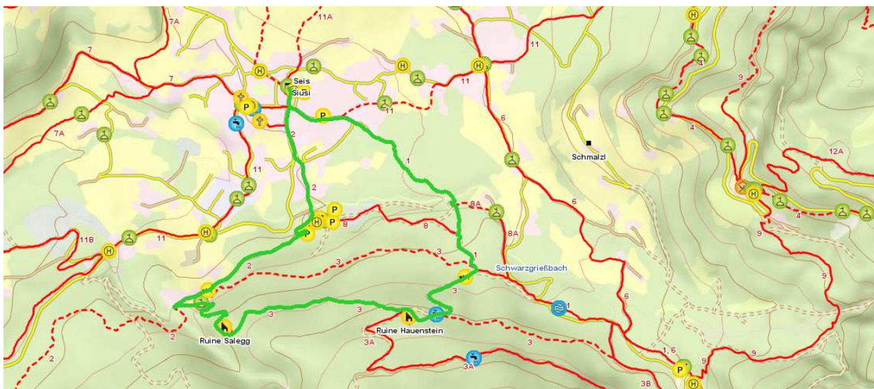
Karte © 2007 TuGA - Lana